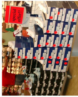
At the sports shop

4 lb. £ 1.10 ✓ 4 lb. £ 1.26 ✓ 4 lb. £ 1.65 ✓