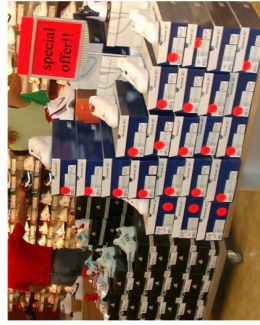
At the sports shop