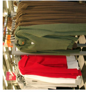
At the clothes shop