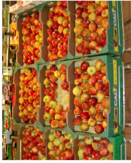
At the supermarket