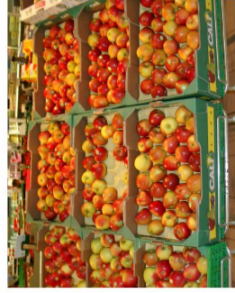
At the supermarket